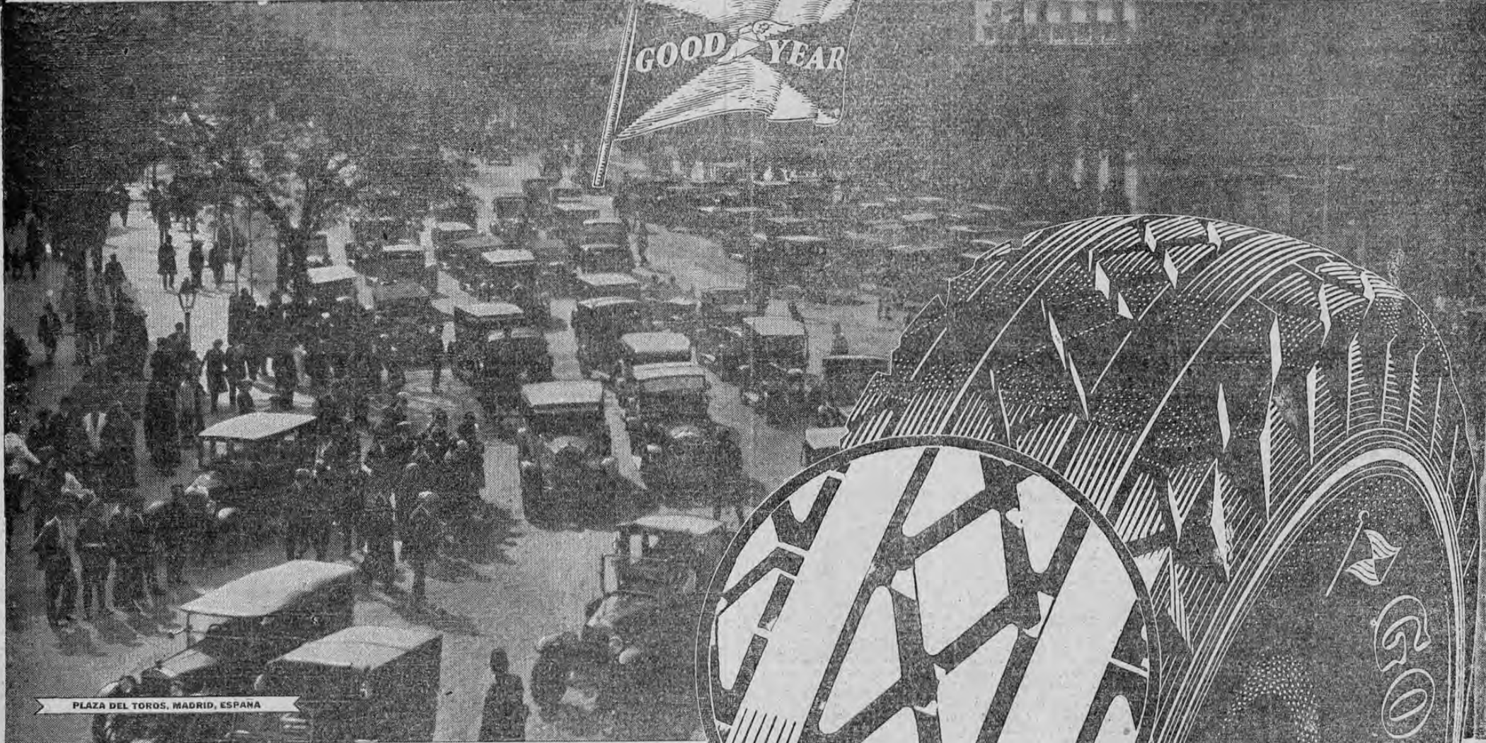
PLAZA DEL TOROS, MADRID, ESPAÑA