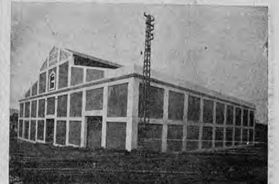
Una vista del primer almacén de depósito que se ha construido en la ciudad de Alajuela y que se pondrá al servicio público el mes entrante.

Uno en esta capital y otro en la ciudad de Cartago.— El de esta capital se llamará "Almacén Central de Depósito" y el otro "Depósito Agrícola" de Cartago. El Banco Nacional prestará las sumas para construir los edificios.—El mes entrante será puesto a servicio público el almacén de depósito construido en Alajuela.